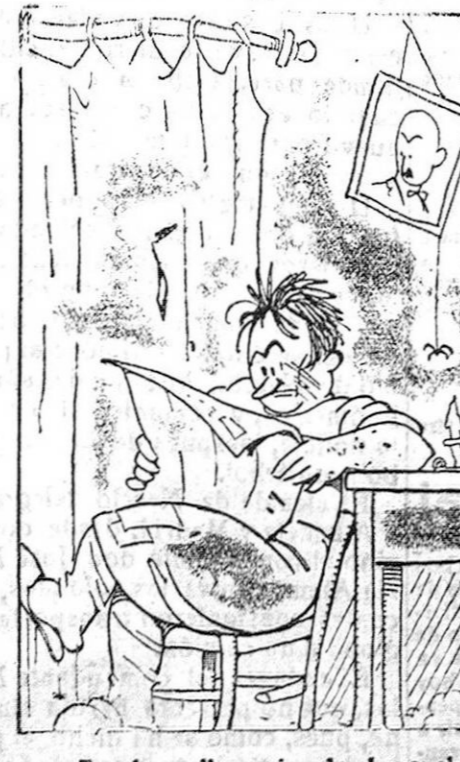
—Tres horas lleva mirando el «papel» a ver si averigua el precio de la verduera. —¡Caray! —Bueno... ¡es que no sabe leer!

Los precios están al alcance de todo el mundo: Palcos sencillos, 30 pesetas; palcos dobles, 50; delanteros de Terraza, 5; delanteros de palco de chiqueros, 6; delanteros de palco de tendido, 5; delanteros de vomitorio, 1; sobrepunte principal, 4; asiento de banderilla, 2; asiento de palco de tendido, 4; primera fila de tendido, 1; sillones, 4; barreras, 5.