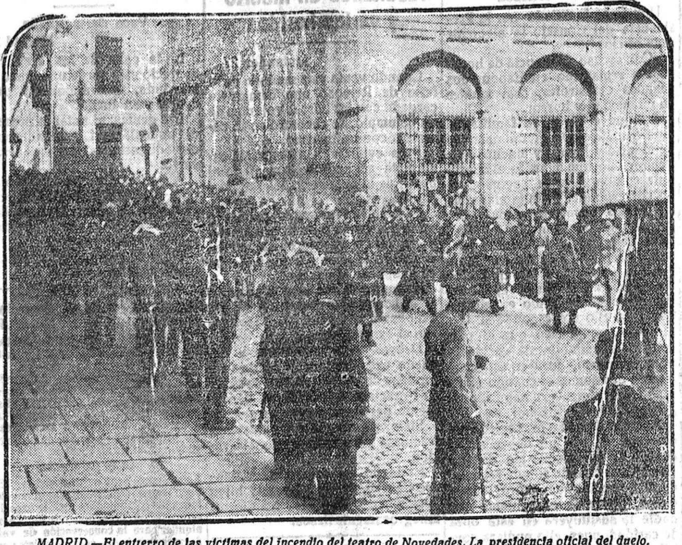
MADRID.—El entierro de las víctimas del incendio del teatro de Novedades. La presidencia oficial del duelo.