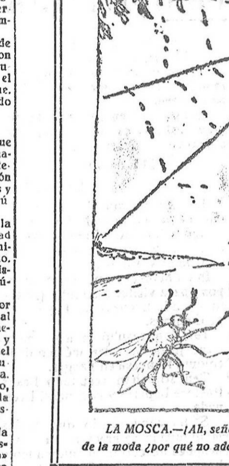
LA MOSCA.—¡Ah, señora araña! Usted que tanto gusta de la moda ¿por qué no adopta la su hilos?