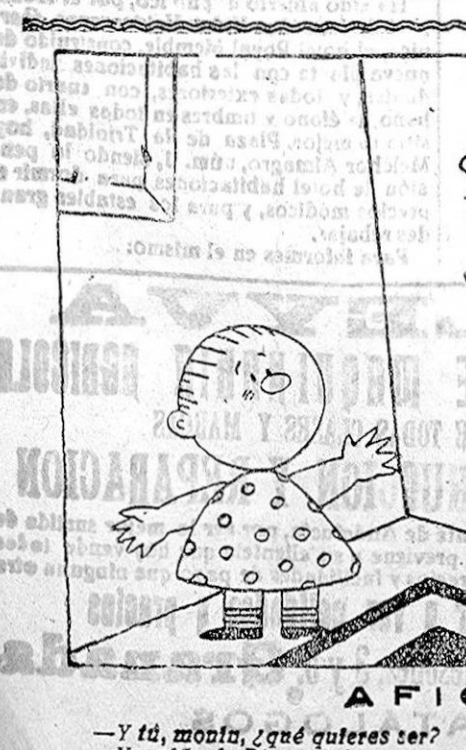
—Y tú, mujer, ¿qué quieres ser? —Yo, niño de Bienvenida.