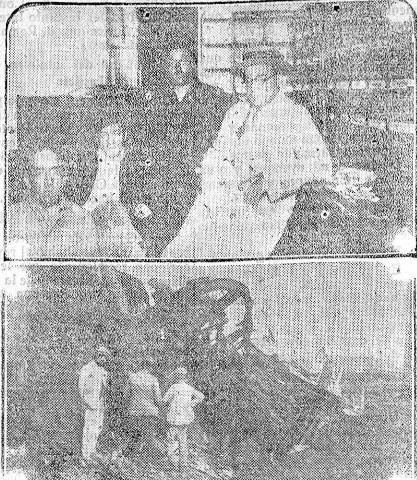
LA CATASTROFE DE LAS MADRIGUERAS.—Arriba, los oficiales de Correos que quedaron con vida. Abajo, estado en que quedó el coche correo del expreso ascendente.

Hay que pensar en esto con verdadero cariño. Hay que difundir el amor a los libros en Granada. Porque aquí no se hace nada práctico en favor del libro: aquí no hay Bibliotecas populares; pero, en cambio, tenemos abiertas dos plazas de toros, y hoy mismo podremos expansionarnos en dos fiestas taurinas. El síntoma es tremendo y desconcertante. Sobre todo, teniendo en cuenta que se celebra una Fiesta del Libro sin libros y con toros... Nosotros quisieramos que en Granada tuviera la Fiesta del Libro seriedad y trascendencia. Hablamos con el pensamiento puesto en el porvenir. Por hoy no hemos de hacernos ilusiones.