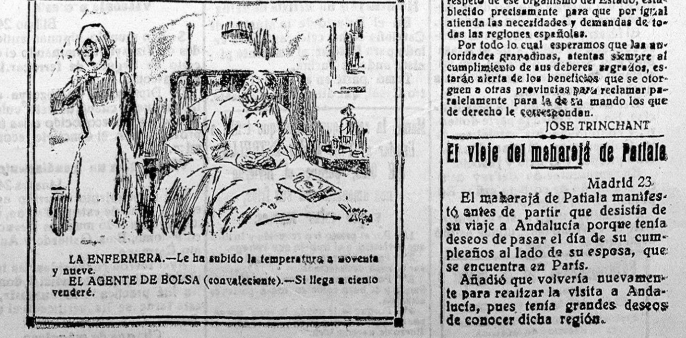
LA ENFERMERA.—Le ha subido la temperatura a noventa y nueve. EL AGENTE DE BOLSA (convaleciente).—Si llega a ciento vendré.

dejaros la parte narrativa para omitir una modesta opinión—ese último momento exteriorizado un deseo perfectamente lógico. Porque admitida la retórica en las fiestas nupciales, parece natural que el novio haga el resumen de los discursos y exponga ante los invitados su programa matrimonial. Brindamos la felicitación a los amantes de la epistola de San Pablo. CONSTANCIO