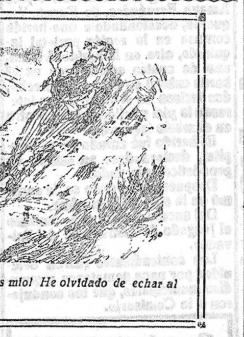
EL NAUFRAGO.—¡Dios mío! He olvidado de echar al correo la carta de mi mujer.