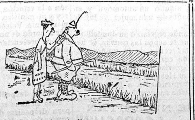
ELLA.—En la gata dice que hay un puente a tres kilómetros de aquí. EL.—¡Qué estupidez! ¡Levantar un puente a tres kilómetros del río!