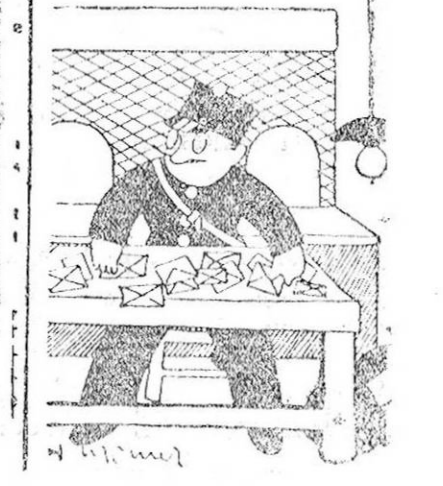
EL CARTERO.—¡Qué fatal Tener que repartir tantas cartas... Me dan ganas de mandarlas por correo.