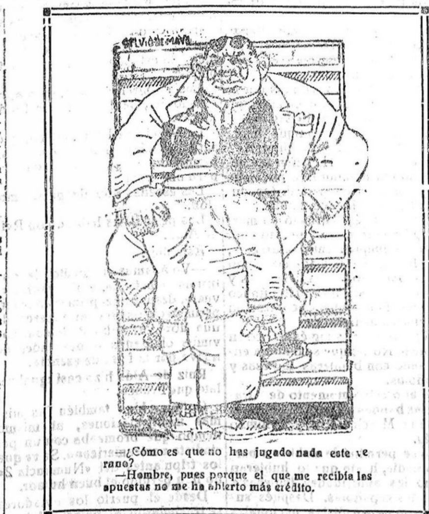
Como es que no has jugado nada este verano? — Hombre, pues porque el que me recibía las apuestas no me ha abierto más crédito.