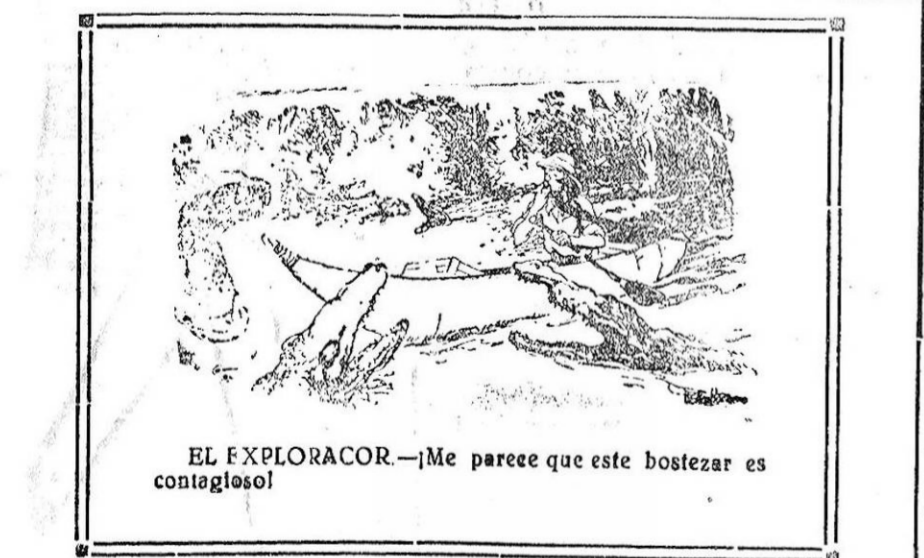
EL EXPLORADOR.—¡Me parece que este bostezar es contagioso!