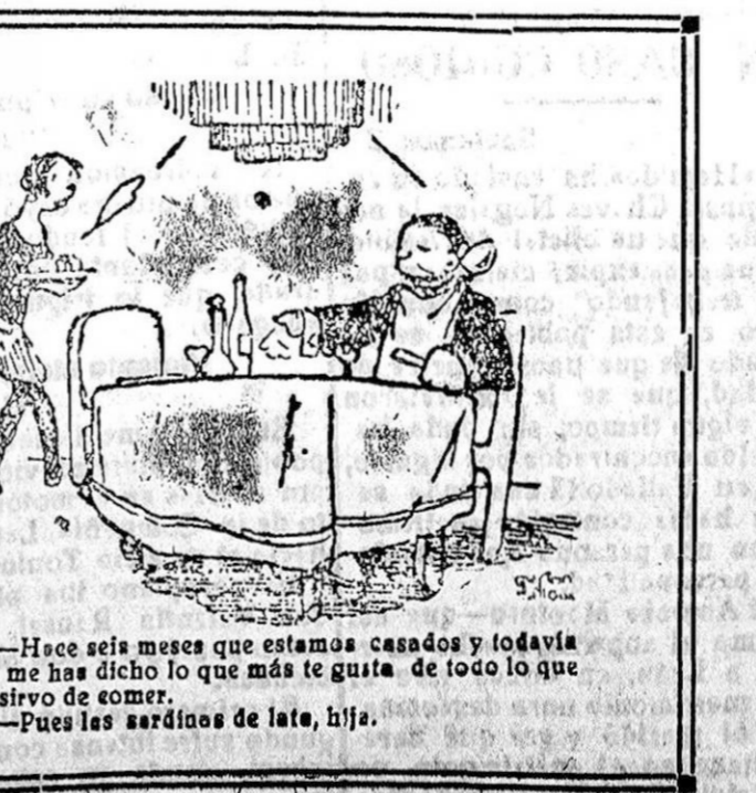
—Hace seis meses que estamos casados y todavía no me ha dicho lo que más te gusta de todo lo que le sirvo de comer. —Pues las ardidas de lata, hiji.

Roma 2 Sábase que el Papa no saldrá del Vaticano este verano, en contra de lo que se dijo primeramente. El viaje que se proponía realizar su santidad ha sido aplazado para más adelante.