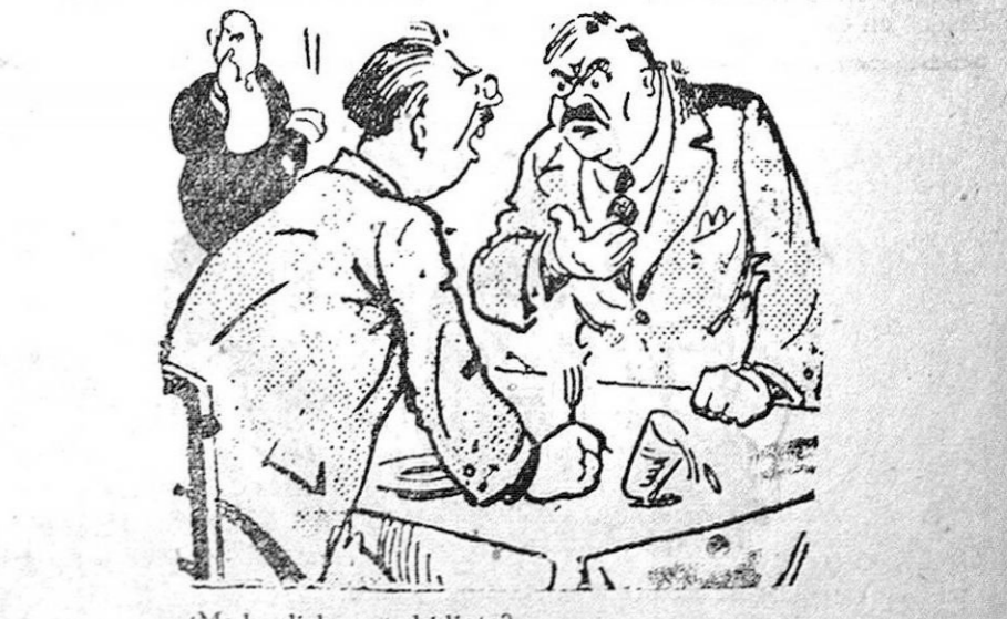
—¿Me ha dicho usted idiota? —Sí; pero no a usted, pues supongo que no es usted el único en el mundo.

8.45. Expreso, con primera y tercera clase para Madrid. 11.25. Para Moreda, con combinación para Baza y Almería. 13.10. Para Moreda, Linares y Madrid. En Baza, enlace con el nuevo expreso Sevilla-Valencia-Barcelona. 13.25. Para Algeciras, con combinación para Málaga, Sevilla, Ecija y Luque.