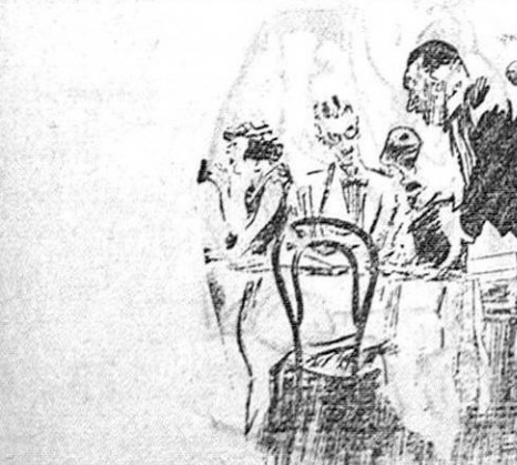
— ¡Vese ese pescador. Huele muy mal. — No le extraña a usted. El pobre, desde que lo pescaron, no ha visto el agua para un remedio...

Confiamos del celo y rectitud de la 4.ª División de Ferrocarriles sean adoptadas en muy breve plazo las medidas de seguridad y vigilancia dictadas, por la intensidad del tráfico moderno desarrollado en la mencionada carretera de Bailén a Málaga, en evitación de posibles riesgos en estos cruces.»