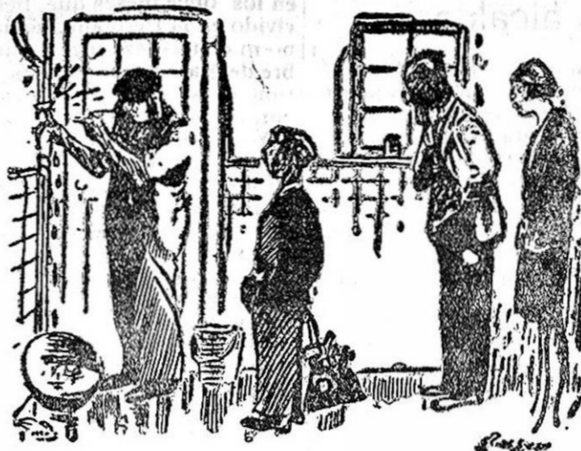
EL FONTANERO (al aprendiz).—Aprende, niño, aprende... Cuando veas que es un agujerito que se tapa en tres minutos, no tienes que hacer más sino tardar tres horas y media.

—Pero—replicó el rey—¿qué opinión tiene usted de su cabeza? —Señor—replicó Bacón—la gente de alta estatura se parece a las casas de varios pisos, que el último es el peor amueblado.