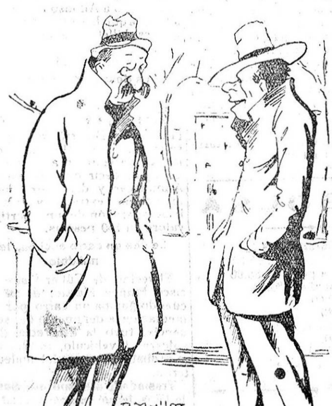
—Yo traje de América 5.000 pesos y no me queda ninguno. —Pues menudo peso se ha quitado usted de encima. (De «La Unión Mercantil».)