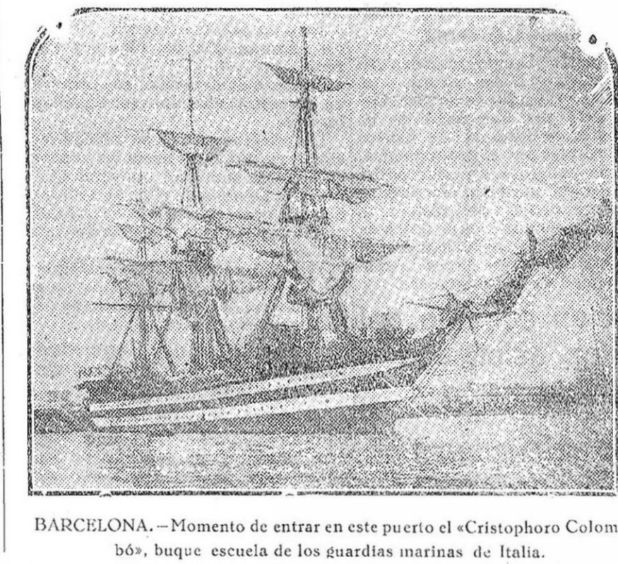
BARCELONA.—Momento de entrar en este puerto el «Cristophoro Colombo», buque escuela de los guardias marinas de Italia.