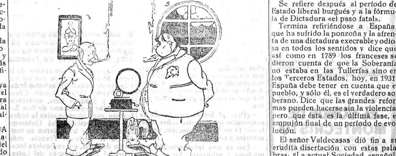
Hombre! ¿Has impresionado un disco con la voz de tu mujer? — Sí. Para darle la satisfacción de hacerle callar cuando se me artoje.