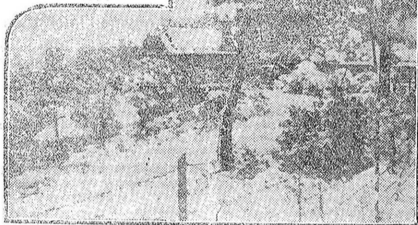
Pintoresca vista que ofrecen los alrededores de la capital de Cataluña—el Tibidabo—después de la intensa nevada que cayó días pasados.