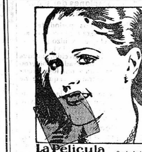
La Película. Según la investigación odontológica altera el color natural de los dientes y provoca serios desórdenes en la dentadura. Debe combatirse diariamente.