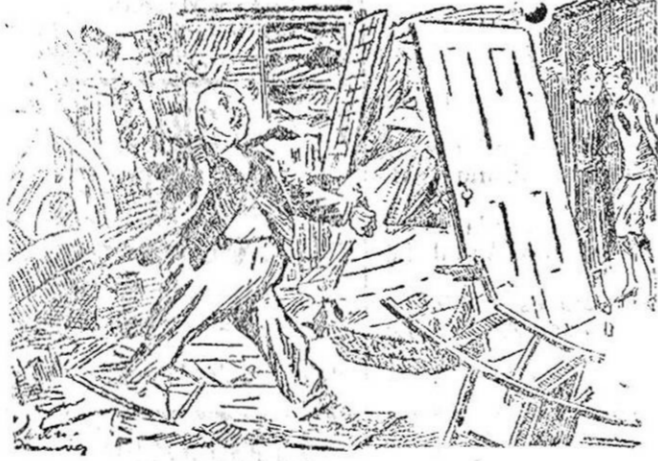
LA MADRE.—Querida, hubiera sido más económico hablarte de eso en el jardín.

Contestando a preguntas de los informadores, dijo que el próximo Consejo tendría lugar el sábado,