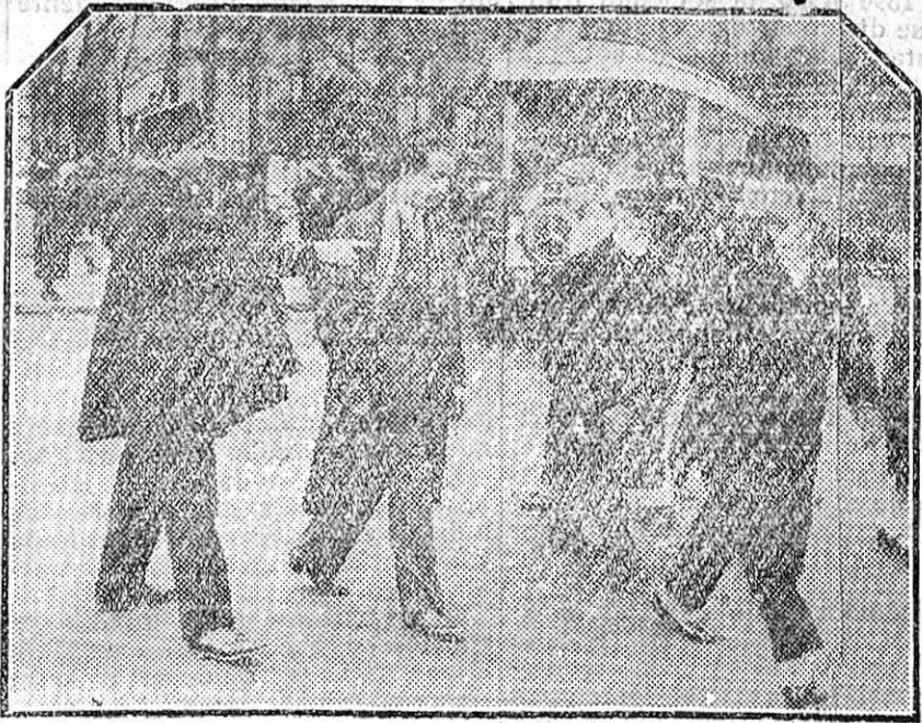
París ha señalado ahora con dos líneas de gruesos y brillantes dardos la forma que deben seguir los peatones para atravesar la calzada en calles de gran tránsito vehicular. Los madrileños hace ya varios años que disfrutaban de estos relativos oasis para los que no poseemos automóvil, mientras los parisienenses están aprendiendo a andar como es debido, bajo la mirada vigilante y el dedo imperativo de los «sergents de ville».

El hombre que sigue a éste en fortuna es el príncipe Tassilo Festetich, que hoy cuenta 80 años, y es uno de los más exclusivos aristócratas húngaros. Su fortuna, si bien es grande, se queda muy atrás de la del joven Esterhazy. Sus posesiones tienen una extensión de 56 000 hectáreas. Al contrario del príncipe Esterhazy, el príncipe Festetich dedica muy poco tiempo a la administración de sus bienes. Es un cazador apasionado, y a pesar de su avanzada edad, va de caza casi diariamente, tanto en invierno como en verano. Viaja siempre en tren especial y lleva en su castillo de Keszthely una vida verdaderamente de príncipe. Es muy amigo de toda clase de detalles, y así por ejemplo, cada vez que su coche sale del castillo, se extiende una gran alfombra roja a su paso. Desde hace muchos decenios, solamente una vez se vio obligado el príncipe Festetich a tener que desistirse de sus comodidades y costumbres. Durante el Gobierno de los comunistas bajo la presidencia de Bela Kun, le fueron confiscados todos sus bienes, y tuvo que salir de Hungría como un pobre mortal en un vagón de tercera clase. Cuando cayó el comunismo en Hungría, recibió de nuevo sus bienes. Hoy sigue viviendo en el mismo aislamiento de antes, y es la más orgullosa encarnación del aristócrata húngaro de la antigua escuela.