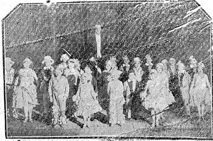
En la Sala de Milán se ha presentado una compañía de lillputtenses, que cantan maravillosamente diversas óperas, y en la cual hay, además de excelentes tiples y sopranos, magníficos barítonos y tenores. En cuanto a bajos, los habrá, como es lógico, insuperables.