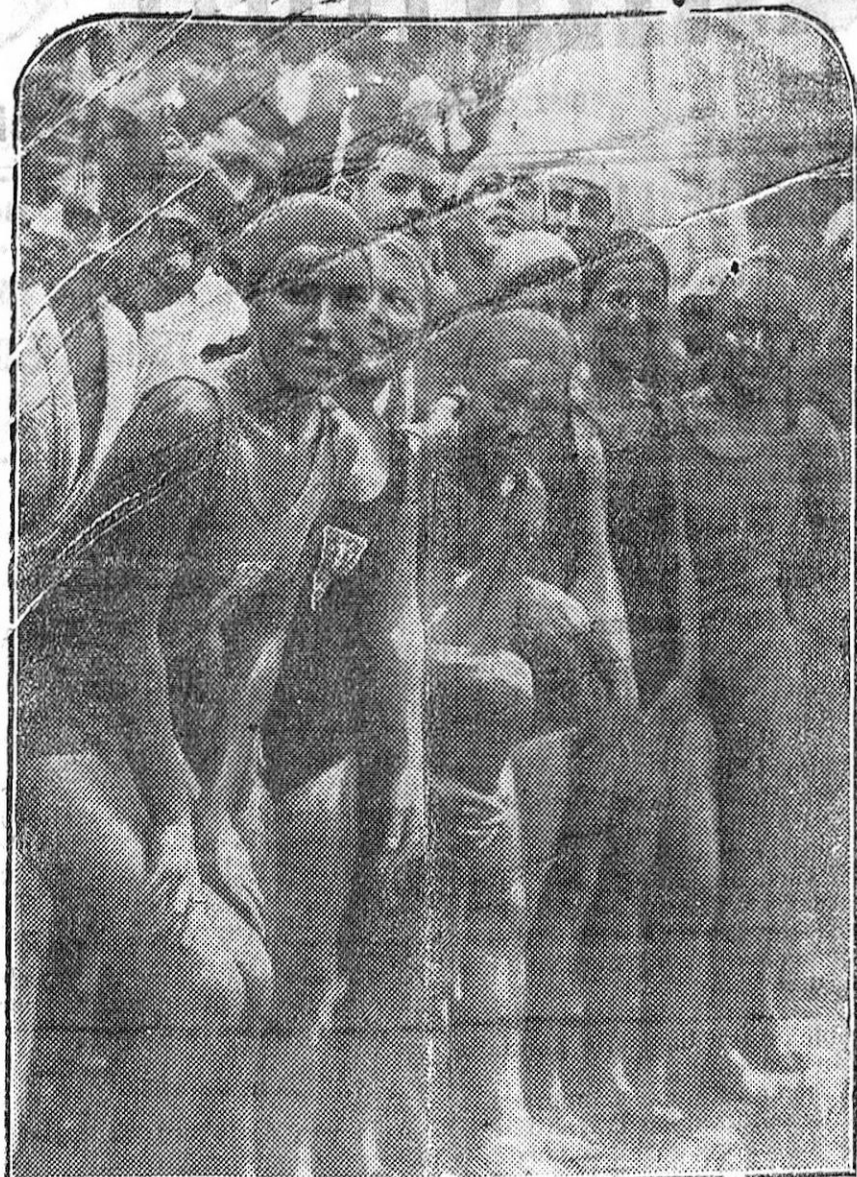
La travesía a nado del puerto de Barcelona tenía también, como todos los años, una clasificación femenina. He aquí las concursantes momentos antes de lanzarse al agua.

Aunque jovencita sabía dirigir la casa como una mujer. Y todos obedecían sus órdenes y la adoraban.