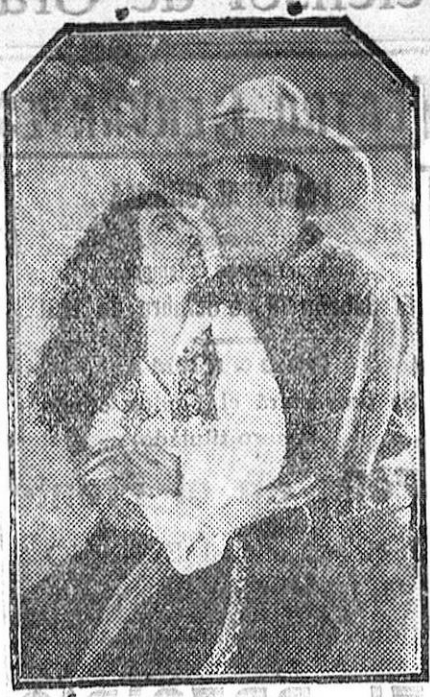
Creaciones del cine.—Dorothy Burgess y John Mack Brown en «Larca de Río Grande».