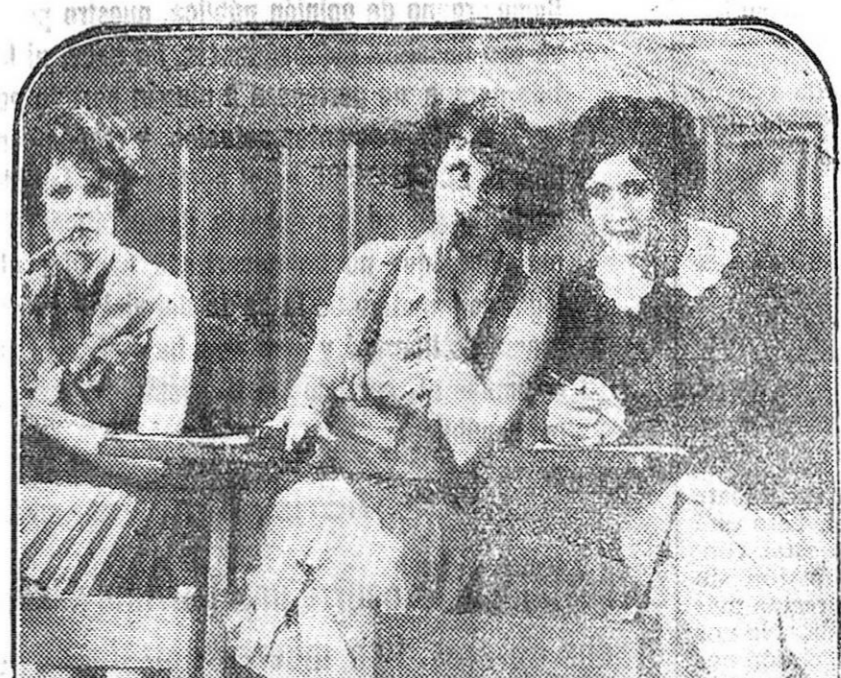
La inquieta y popular artista Clara Bow en una escena de la cinta «La loca orgía».