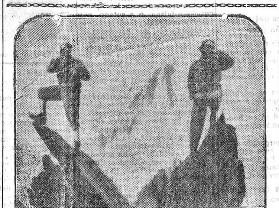
Creaciones del cine.—Un arrebatado momento de la película «Tempestad en el Mont-Blanc».

Hasta la hora de escribir estas líneas no tenemos noticias de que el Juzgado haya intervenido de nuevo.