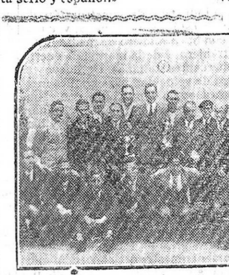
Los campeonatos de España de aficionados al boxeo. Los participantes, con los directivos de las Federaciones regionales, en el frontón del Club Deportivo.

Esto será resolver los «problemas de las lenguas» con un punto de vista serio y español.»