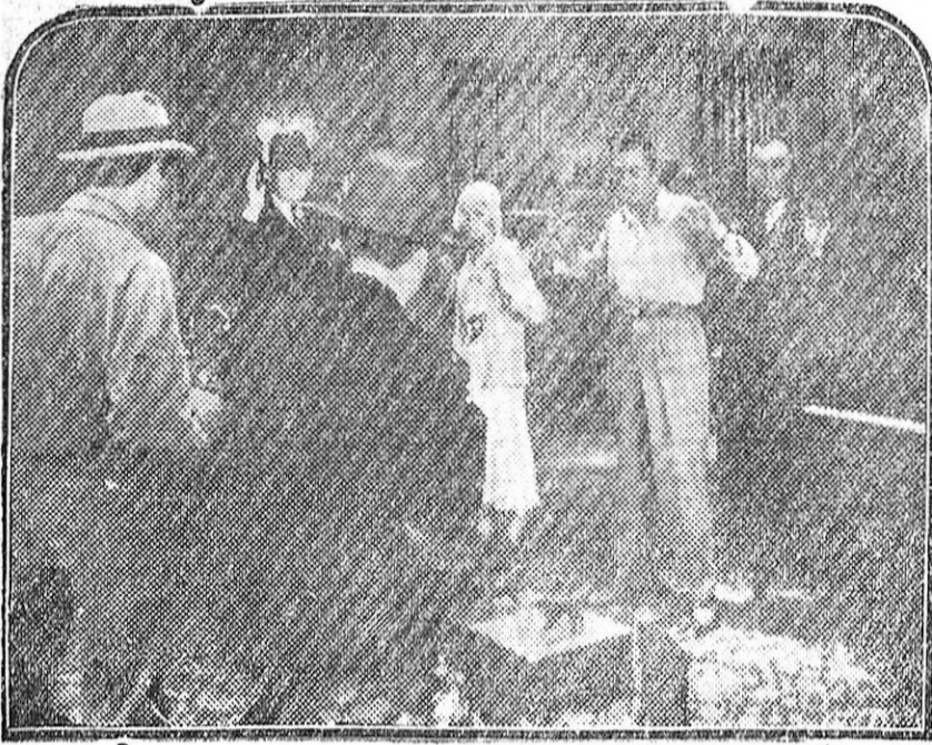
Una interesante escena del film parlante en episodios «Huellas dactilares».