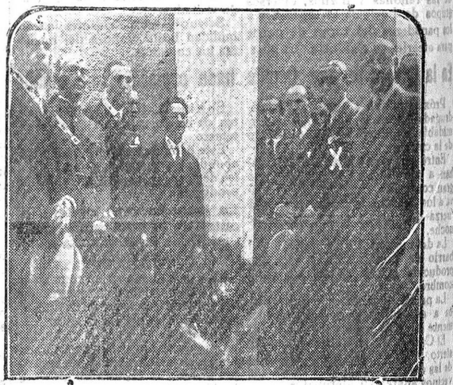
El embajador de España en Londres, señor Pérez de Ayala (X), en el homenaje a «Clarín», en Oviedo.