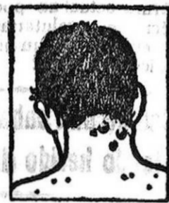
Granos - Forunculosis