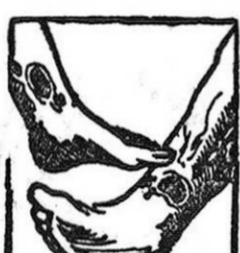
Males en las piernas

La sangre del artrítico esta entorpecida por venenos que provienen de una insuficiencia de vitalidad y por consiguiente, su circulación es del todo defectuosa. Las piernas del enfermo están hinchadas y entorpecidas con varices dolorosas con peligro de ruptura o de ulceración interminable. Con frecuencia el artrítico esta atormentado con dolores gotosos o reumáticos que le hacen achacosos y con el tiempo le agotan. Sus riñones están generalmente obstruidos con nefritis, albuminuria; arena en la orina (mal de piedra) y a veces fuertes dolores en la espalda. Las arterias duras y quebradizas como tubos de pipa (arteriosclerosis) amenazan a cada instante, accidente generalmente pronosticado con insomnios y dolores de cabeza. La mujer artrítica tiene épocas irregulares o penosas y su edad crítica es un largo suplicio, con bocanadas de calor, vertigos, jaquecas, postracion profunda, con frecuencia fibromas o tumores en el vientre. Los artríticos de ambos sexos tienen tambien enfermedades de la piel, acné, eczemas, herpes, sarpullidos, prurigo, sporiasis, forunculosis, etc., con lesiones molestas y comezones intolerables. Todos esos enfermos de la sangre, todas esas víctimas mártires del artritis-mo no tienen que desesperarse y creerse incurables pues el