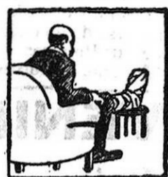
Gota - Dolores