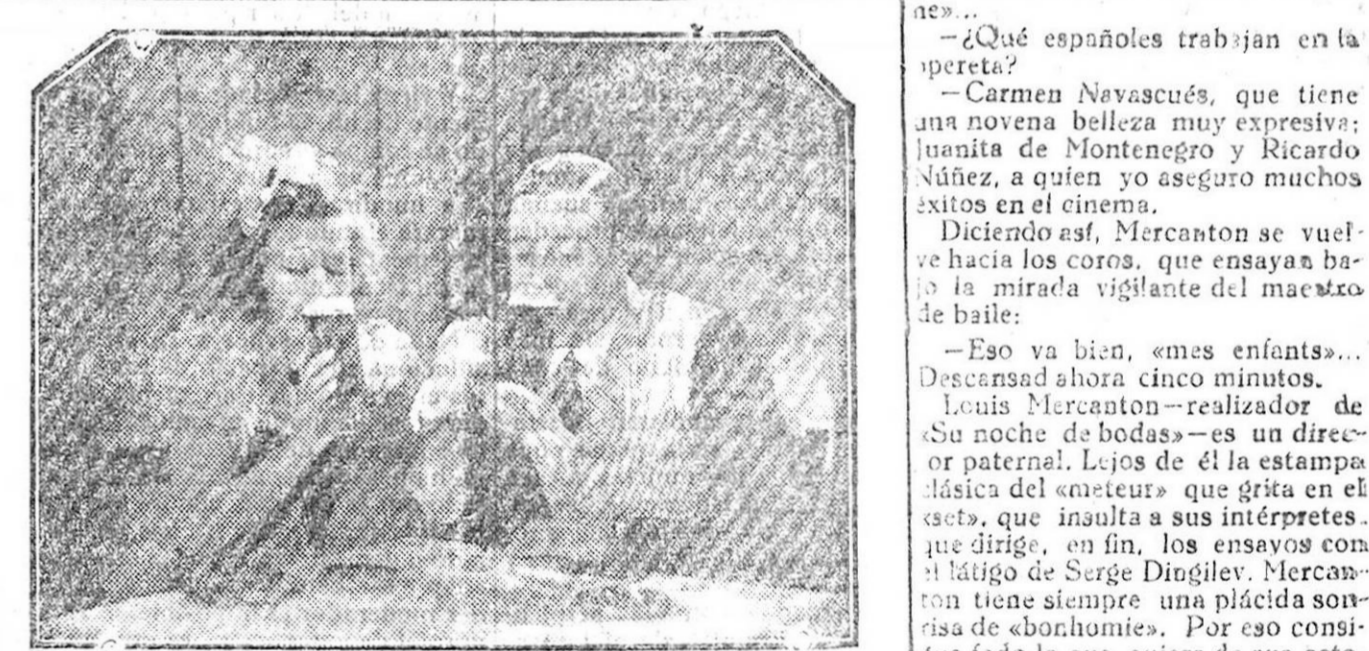
Una interesante escena de la película «El favorito de la guardia».