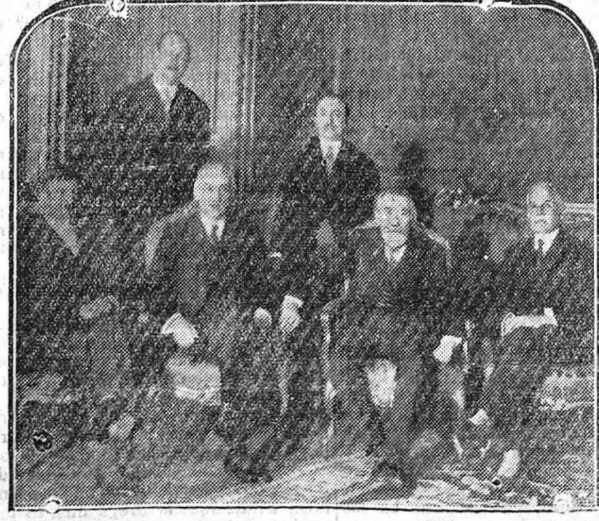
Lord Reading ha celebrado una entrevista de contacto y comprensión con los señores Laval, Briand y Flandin. Helos aquí reunidos en el ministerio de Negocios Extranjeros de Francia. A su regreso a Londres lord Reading parece que se ha mostrado satisfecho de su viaje y tal vez de su gestión.