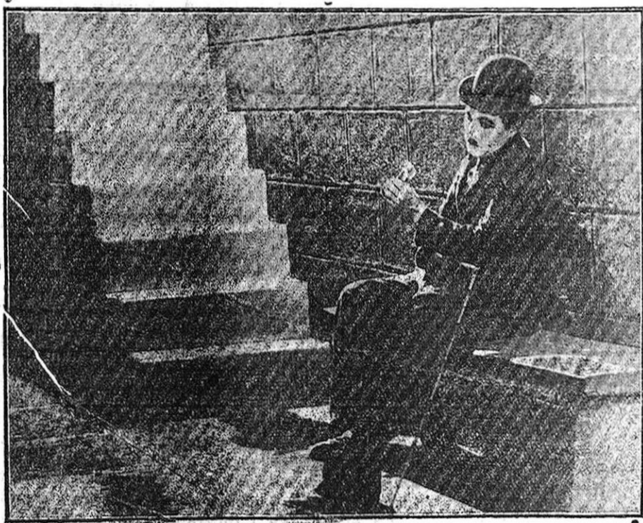
Charles Chaplin (Charlot) en su última producción «Luces de la ciudad», que próximamente se estrenará en Granada.

Guerra del Río (conferenció con el diputado señor Gil Robles, al que le rogó hiciese cuantas gestiones pudiera para lograr la vuelta al Parlamento de la minoría vasco-navarra. Este prometió hacerlo así.