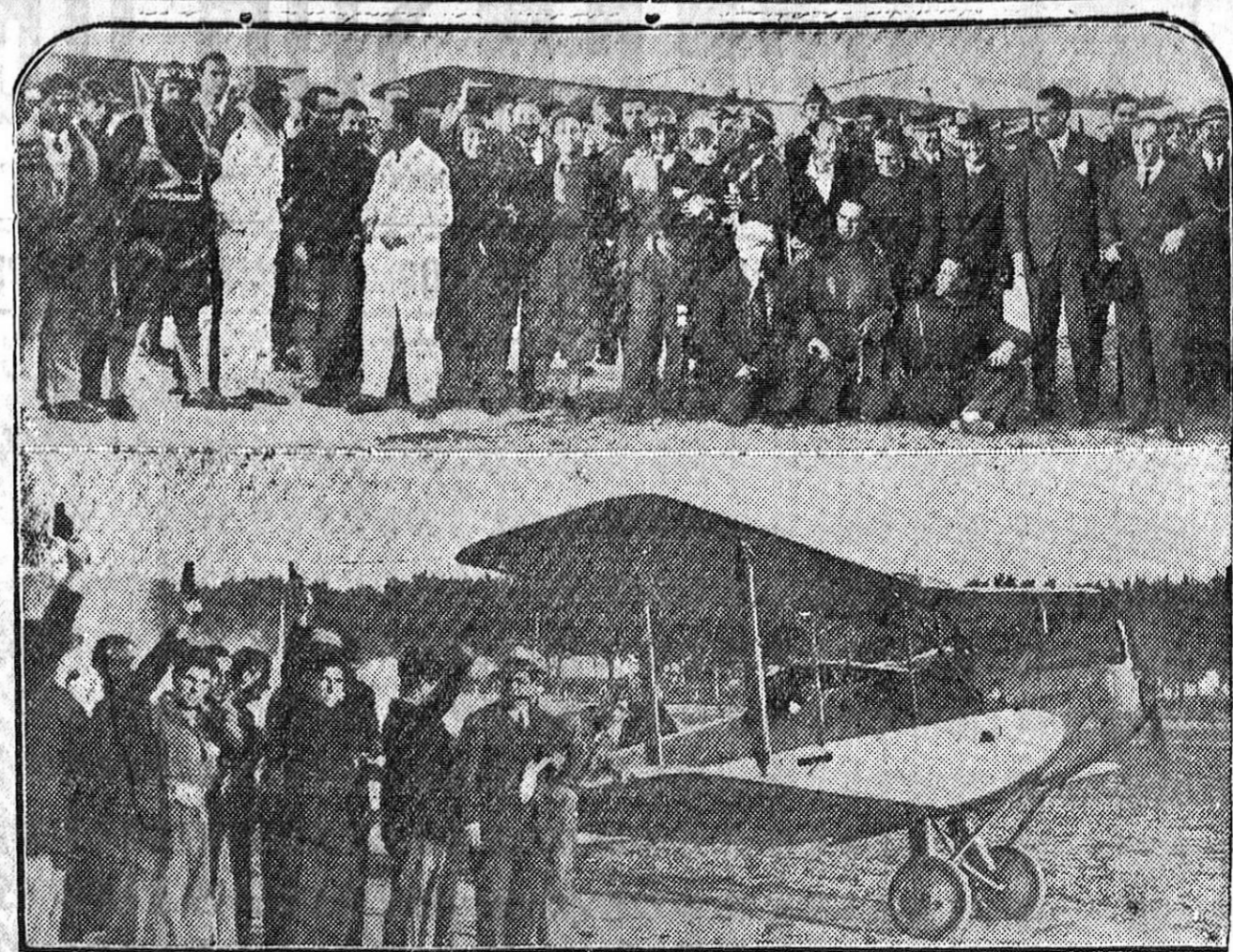
La vuelta a España en avión, iniciada en Getafe. El starter da la salida a uno de los aparatos. Arriba, un grupo de concursante.

En el Asilo Nocturno pernoctaron 27 indigentes