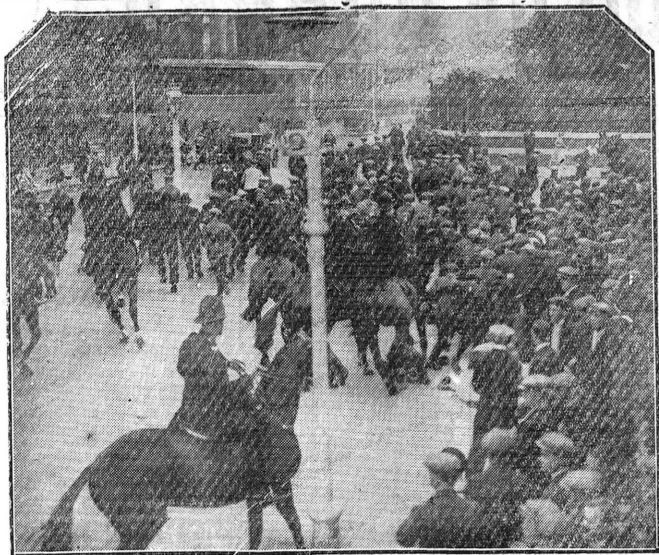
LONDRES.—Una carga de la fuerza pública para disolver una manifestación de obreros parados.

Precios a que se vende en el mercado: Carne de 1.ª, 5,50; de 2.ª, 5,00; de 3.ª, 4,50; de 4.ª, 4,00; borrego con hueso, 3,75.