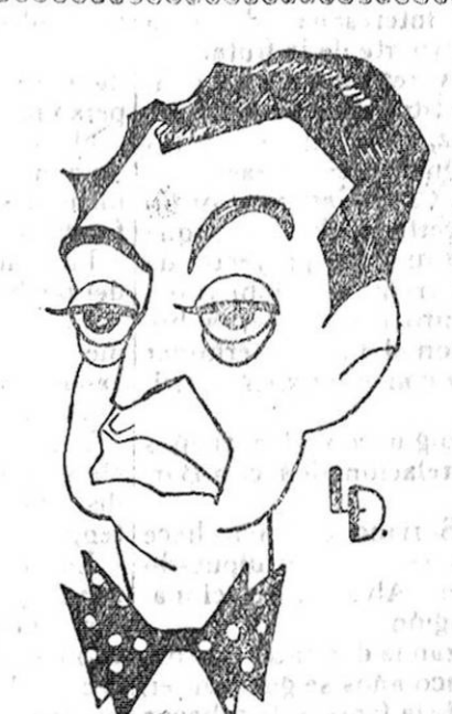
EL JOVEN CATEDRÁTICO DON JOAQUIN GARCIA LABELLA

Es más; en principio la preocupación de lucro debe ser ajena a la municipalización. Y así, junto a la causa financiera figura una causa política. Los municipios tratan de emanciparse de la tiranía que sobre ellos ejercen los concesionarios, que ahogan su libertad y corrompen su política. El conferenciante hace ver cómo la potencia industrial, surgida de la libertad, se convierte en su enemiga, tratando de someterse a los poderes políticos. Estudia el hecho en Norteamérica, donde se ha presentado con más relieve. Aunque con tonos menos vivos se da en Europa. Además, las concesiones son un semillero de litigios, debido a la falta de claridad y de limitaciones de las primeras concesiones, como resulta de los ejemplos que cita, la lucha mantenida por Londres, París, Bruselas y otros grandes municipios con sus concesionarios, que no han podido vencer más que con la municipalización. En estos casos el municipio ha tratado de mantener un buen orden de la cosa pública, que es un deber imperioso asegurar.