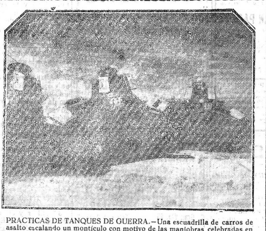
PRACTICAS DE TANQUES DE GUERRA.—Una escuadrilla de carros de asalto escalando un montículo con motivo de las maniobras celebradas en Retamares.

"El Debate" por su parte se limita a decir en sus comentarios parlamentarios que el discurso del señor Barnés es erróneo y que la actitud del obispo auxiliar de Granada es la reglamentaria.