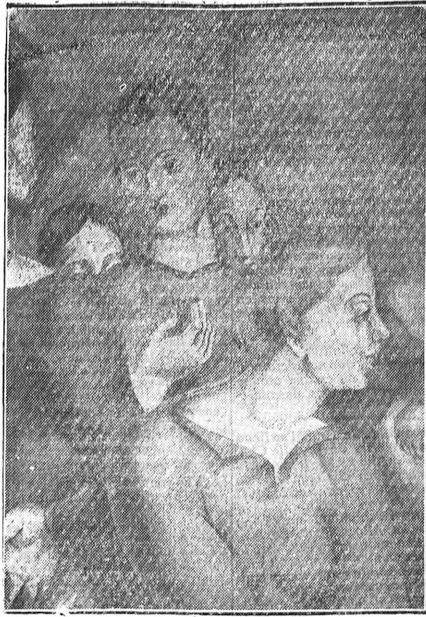
MADRID.—Uno de los admirables paños pintados al fresco por el ilustre artista Sr. Quintanilla, en el salón de conferencias de la Casa del Pueblo.