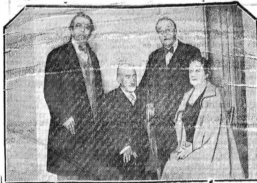
MADRID.—Rosario Pino, Emilio Thuillier y Felipe Sassone, con don Jacinto Benavente, durante la función de homenaje al ilustre comediógrafo, celebrada en el teatro Calderón.

Entre estos últimos se halla Bulgaria, a la que ya nada puede pretenderse, porque los Tratados de paz le quitaron más de lo que podía dar. Le sostiene una esperanza, acaso ingenua: la de ver despertarse la conciencia universal y el idealismo en el mundo. Una cosa pide el respeto de las obligaciones que los vencedores asumieron en virtud de los mismos Tratados. Pese más grave y amarga que la derrota es la decepción y desesperanza de los vencidos cuando ven frustrada su confianza en las promesas pacificadoras.