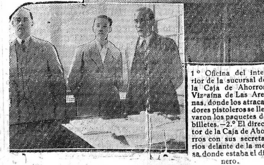
1.º Oficina del interior de la Caja de Ahorros Vizaina de Las Arenas, donde los atracadores pistoleros se llevaron los paquetes de billetes. 2.º El director de la Caja de Ahorros con sus secretarios delante de la mesa donde estaba el dinero.

EL FUGITIVO DEJÓ CAER DURANTE LA HUIDA VARIOS BILLETES POR VALOR DE 500 PESETAS