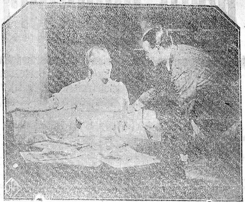
John Gilbert y Louis Wolheim en una escena de la película «El destino de un caballero».

¿Por fin el Hollywood español? Hace días la Prensa de Madrid publicó la noticia de que en Aranjuez iba a instalarse el Hollywood español.