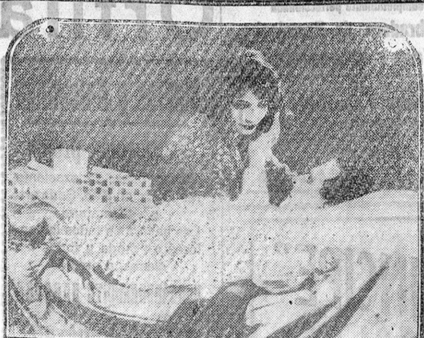
Una escena de la película «Eroticon».

—Aviador, para la guerra. Siempre estaría en el aire, lanzando bombas sobre el enemigo.