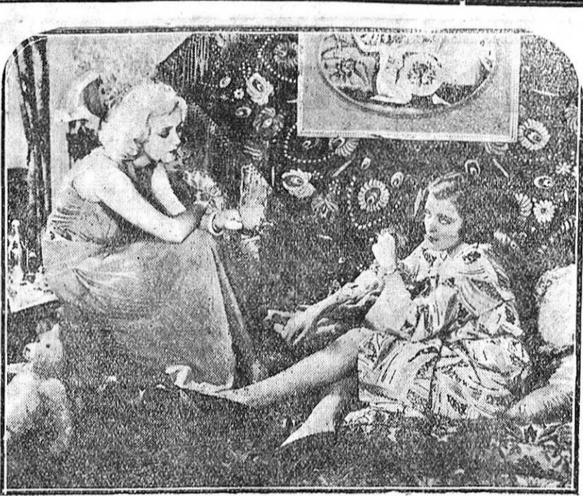
Una interesante escena del film «A 50 brazas», de la Columbia Pictures, que presenta Artistas Asociados.