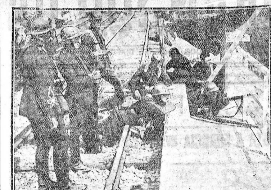
LAS TROPAS CONTRA LOS HUELGUISTAS EN CHARLEROI.—Varios soldados apostados en la vía férrea, amenazada por los huelguistas.