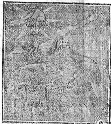
EL NUEVO SOL ALÉMAN El nuevo sol que estaba saliendo para Alemania (el kronprinz), ahora volverá a eclipsarse de nuevo.

EL DEFENSOR confecciona dos ediciones diarias