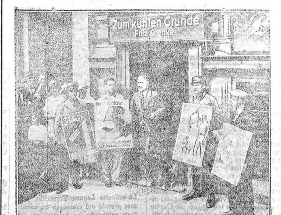
DE LAS ELECCIONES ALEMANAS.—El canciller von Papen saliendo del colegio electoral donde emitió su voto.

La casi totalidad del oro que continúa exportando los Estados Unidos sigue siendo remitido a Europa.