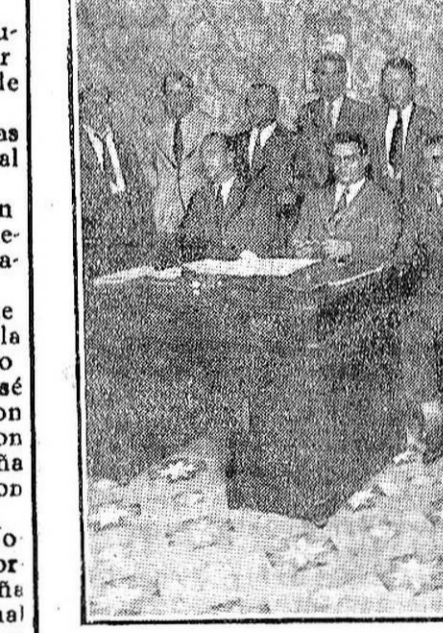
BARCELONA.—Acto de la inauguración oficial de la Unión de sindicatos agrícolas de España, en su local de la Vía Layetana.

es el preferido por todos los buenos garajistas