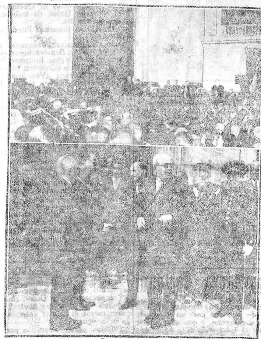
Arriba: sesión inaugural del Congreso Internacional de Telegrafía y Radio-telegrafía en el Senado. Abajo: el presidente del Gobierno, señor Azaña, a la salida, después de inaugurar el Congreso de referencia.