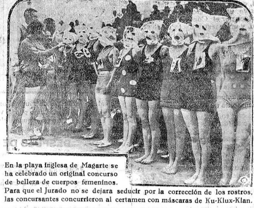
En la playa inglesa de Magarte se ha celebrado un original concurso de belleza de cuerpos femeninos. Para que el Jurado no se dejara seducir por la corrección de los rostros, las concursantes concurren con máscaras de Ku-Klux-Klan.