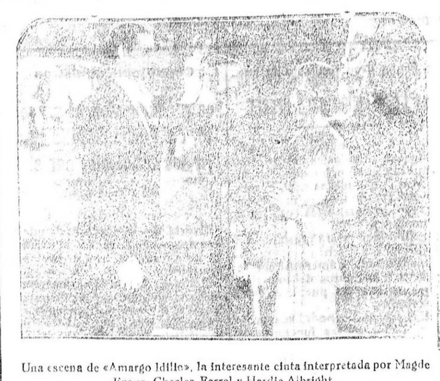
Una escena de «Amargo Idilio», la interesante cinta interpretada por Magde Evans, Charles Farrell y Hardie Albright.

dado calabazas. Sem es el t. xible: no quiere elionas» en su diario; y mientras querellan, el teléfono trae la anacional noticia de que el Pre-fecto Conroy ha sido encausado.