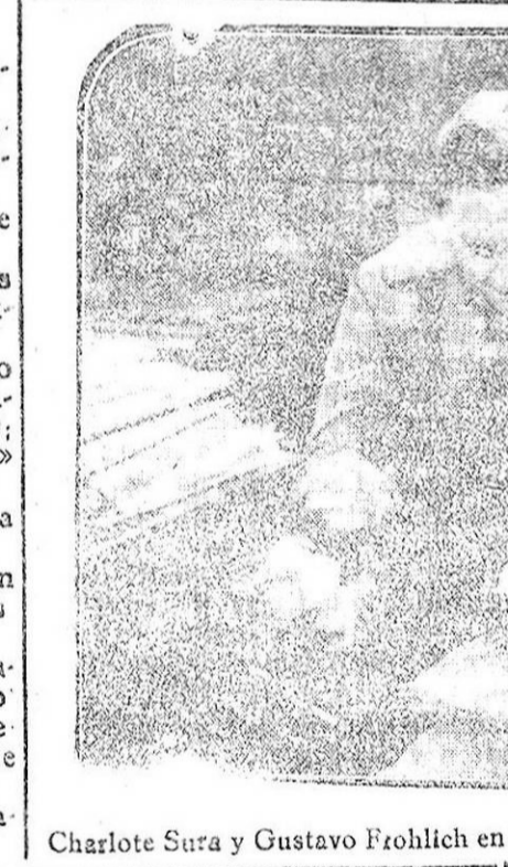
Charlotte Sura y Gustavo Frohlich en la soberbia película «Bajo falsa bandera»

Anne Woodman (Mac Clarke) es «la lorona» de un diario cuyo editor, Sam Bradshaw (Pat O'Brien), la ha despedido por creer que nunca llegará a ser periodista, pero el motivo verdadero es que Anne le ha