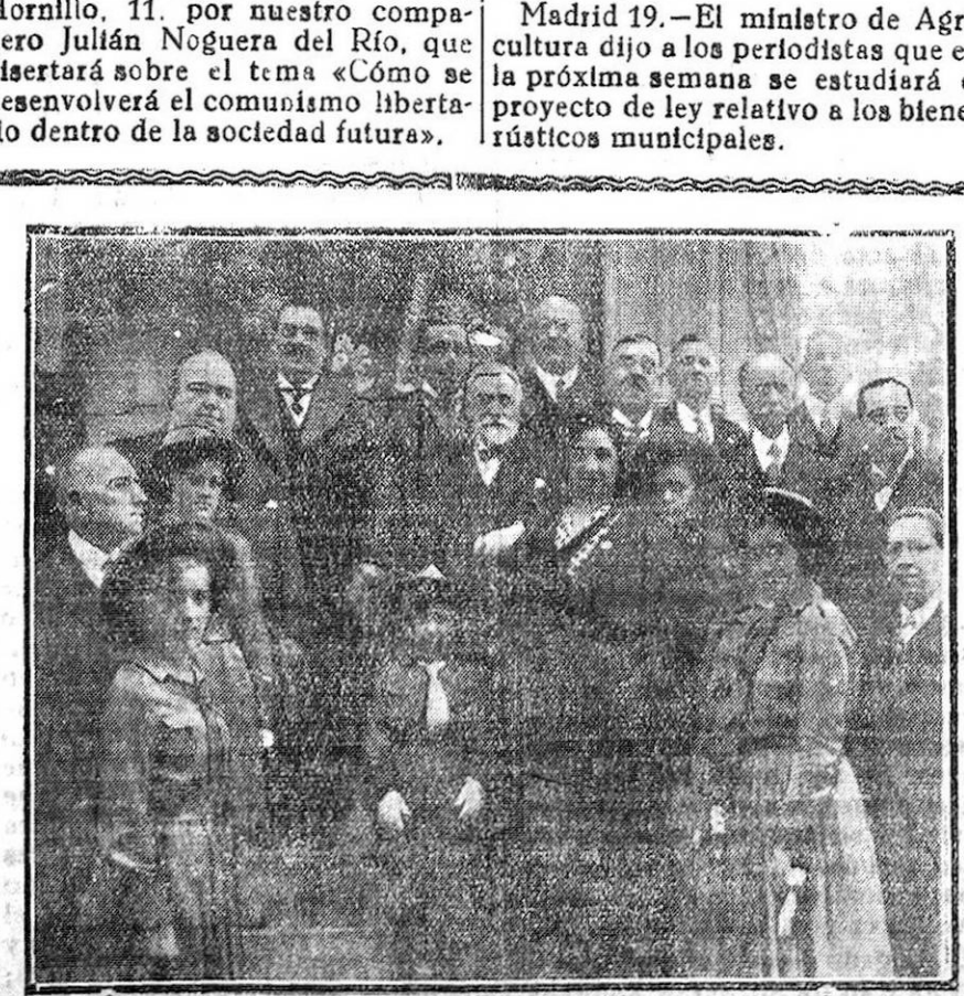
El alcalde de Madrid con los embajadores y ministros americanos que depositaron flores y una lámpara en el monumento a Colón, con motivo de la Fiesta de la Raza

Madrid 19.—El ministro de Agricultura dijo a los periodistas que en la próxima semana se estudiará el proyecto de ley relativo a los bienes rústicos municipales.