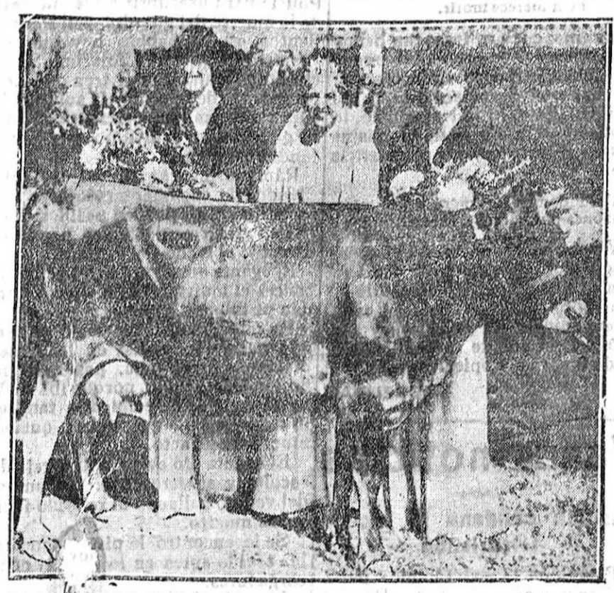
LA REINA DE LAS GRANJAS.—He aquí la joven norteamericana elegida «reina de las Granjas» de los Estados Unidos. Ha querido retratarse con sus dos damas de honor y en compañía de su fiel vaca. La prueba final impuesta a las concursantes consistía en ver cuál de ellas ordenaba mejor!

De interés para los agricultores La Dirección General de Agricultura facilita a todo agricultor que lo solicite, trigo Aragón o catalán de monte limpio y cribado, a 55 pesetas los 100 kilos con envase. En las Secciones Agronómicas, Ayuntamientos, Sindicatos Agrícolas, y escuelas públicas informarán y facilitarán impresos gratuitamente para hacer los pedidos.