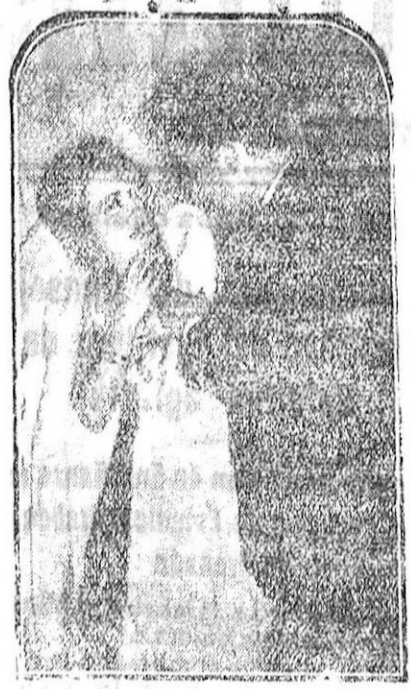
Una interesante escena del film «Tumulto».

Además del incentivo del beso—expresión de cariño que no se practica entre los kanakas y cuyas del