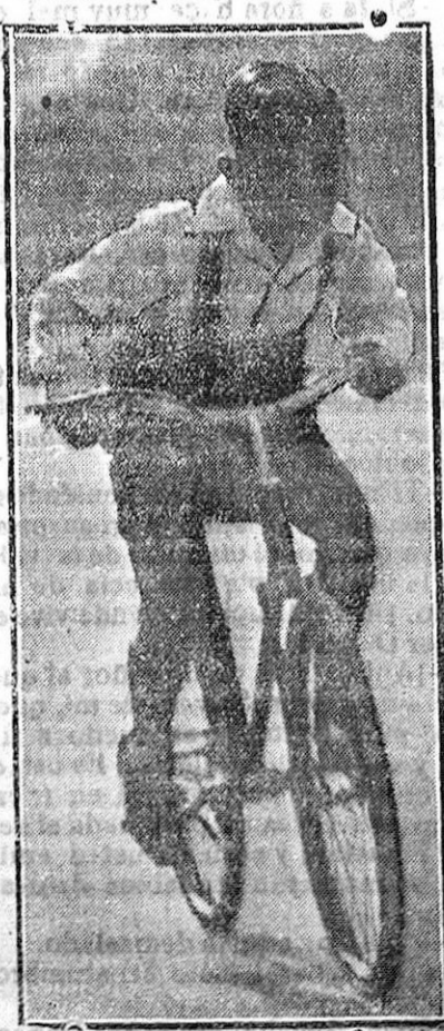
MADRID.—El campeonato ciclista infantil. Un muchacho entrando en la meta.

Madrid 29.—En el ministerio de Estado han facilitado una nota conteniendo el programa de la estancia de Mr. Herriot en España. Se celebrarán los actos ya anunciados, consistentes en una comida, algunas recepciones y visitas a los monumentos. El acto más simpático lo constituirá la visita del jefe del Gobierno francés a Aranjuez, donde impondrá la insignia de la Legación de Honor a un panadero que trabaja en aquella localidad desde chico, que abandonó Francia, su país natal.