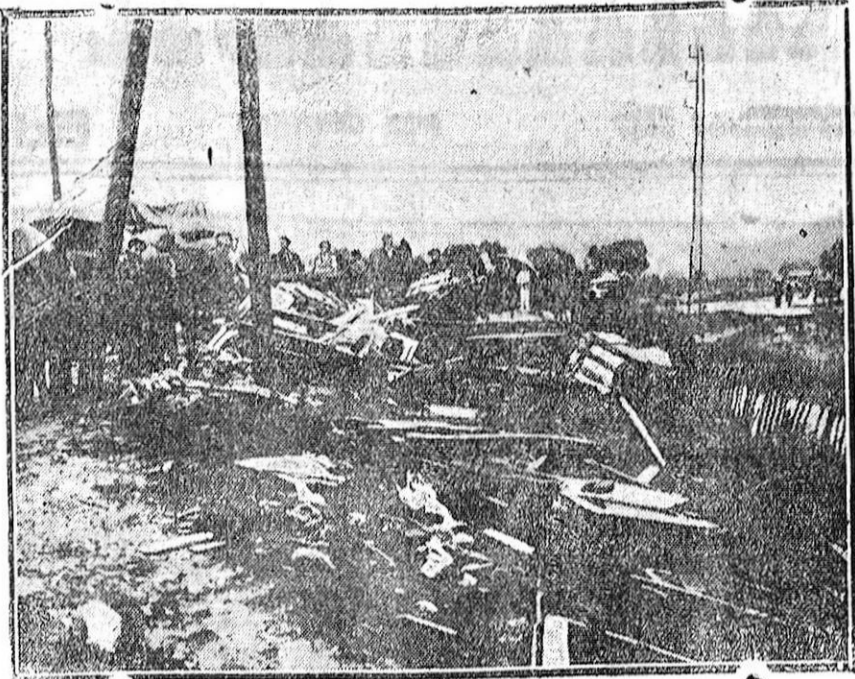
A causa de las grandes inundaciones, descarriló un tren de viajeros entre Perpiñan y Mauri, ocasionando el accidente numerosos muertos y heridos...