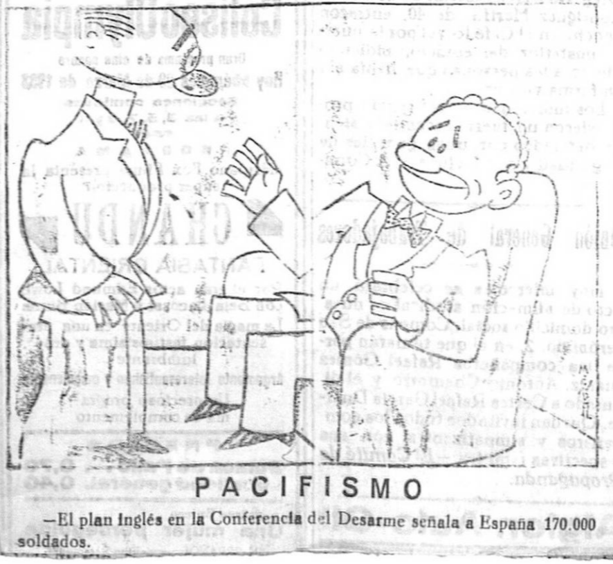
—El plan inglés en la Conferencia del Desarme señala a España 170.000 soldados.

Gabriela Mistral no acepta el Conculado honorario de Chile