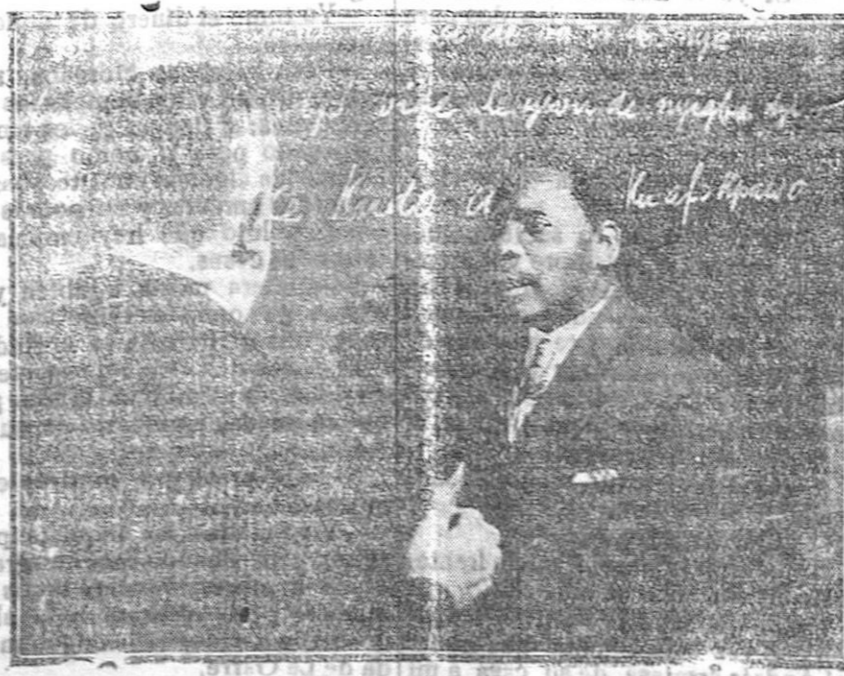
El Seminario orientalista de Berlín ha adquirido fama mundial por sus excelentes trabajos en el estudio de las lenguas orientales. Enseñan lenguas cuyo nombre es desconocido para el gran público, y entre ellas, hasta el