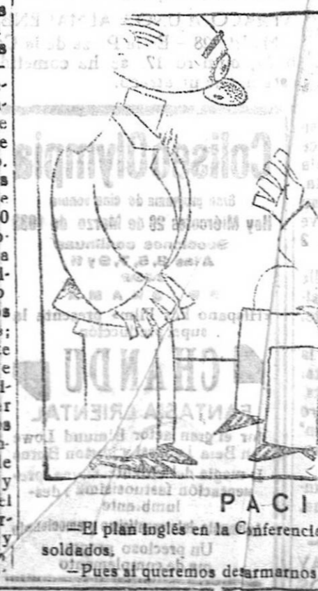
El plan inglés en la Conferencia del Desarme señala a España 170.000 soldados, o sea el 10 por 100 de la población. Pues si queremos detarmarnos, ya podemos ir aumentando el Ejército.

Se está organizando en Granada una Agrupación de Exploradores que de la misma educación al pobre que al rico y que una los diferentes ideales políticos y religiosos, todo ello fundado en el patriotismo y el compañerismo, que son los sentimientos que, debidamente desarrollados y atendidos, han de salvar a España. Se trataron otros asuntos de régimen interior y se levantó la sesión.