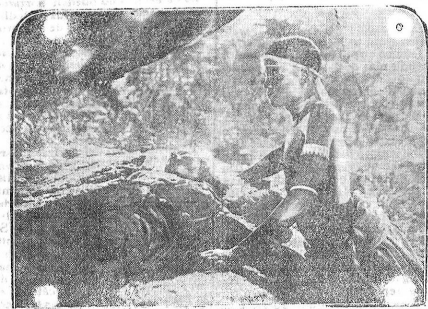
EL CINE. - Una escena del film «Aviones y fieras».

En la Asociación de Caridad se sirvieron ayer 990 raciones. En el Asilo Nocturno pernoctaron 17 indigentes.