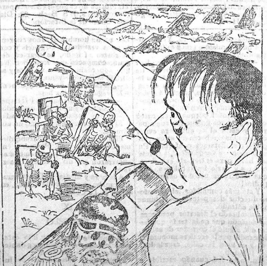
HITLER.—¡Alemania, despierta! LOS MUERTOS DEL 14.—¡Ya vamos, Adolfo, ya vamos!