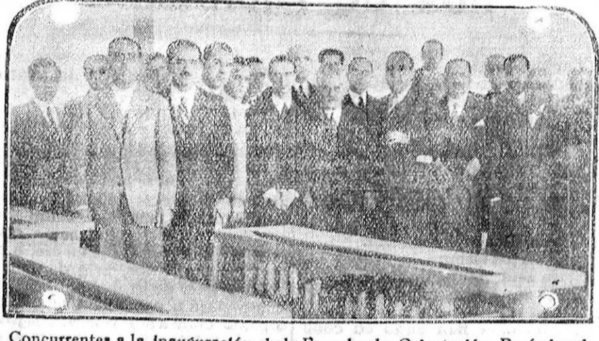
Concurrentes a la inauguración de la Escuela de Orientación Profesional establecida en Tetuán de las Victorias.

Los buenos garagistas siempre deben tener existencias de AIGLON AUTO-OIL pues el público inteligente lo pide, como mejor lubricante