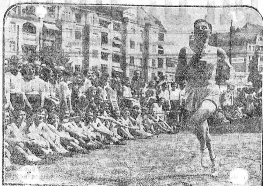
El atletismo es en las Universidades británicas algo que apasiona a los estudiantes de tal forma que sus matches interescales se consideran como verdaderos acontecimientos.