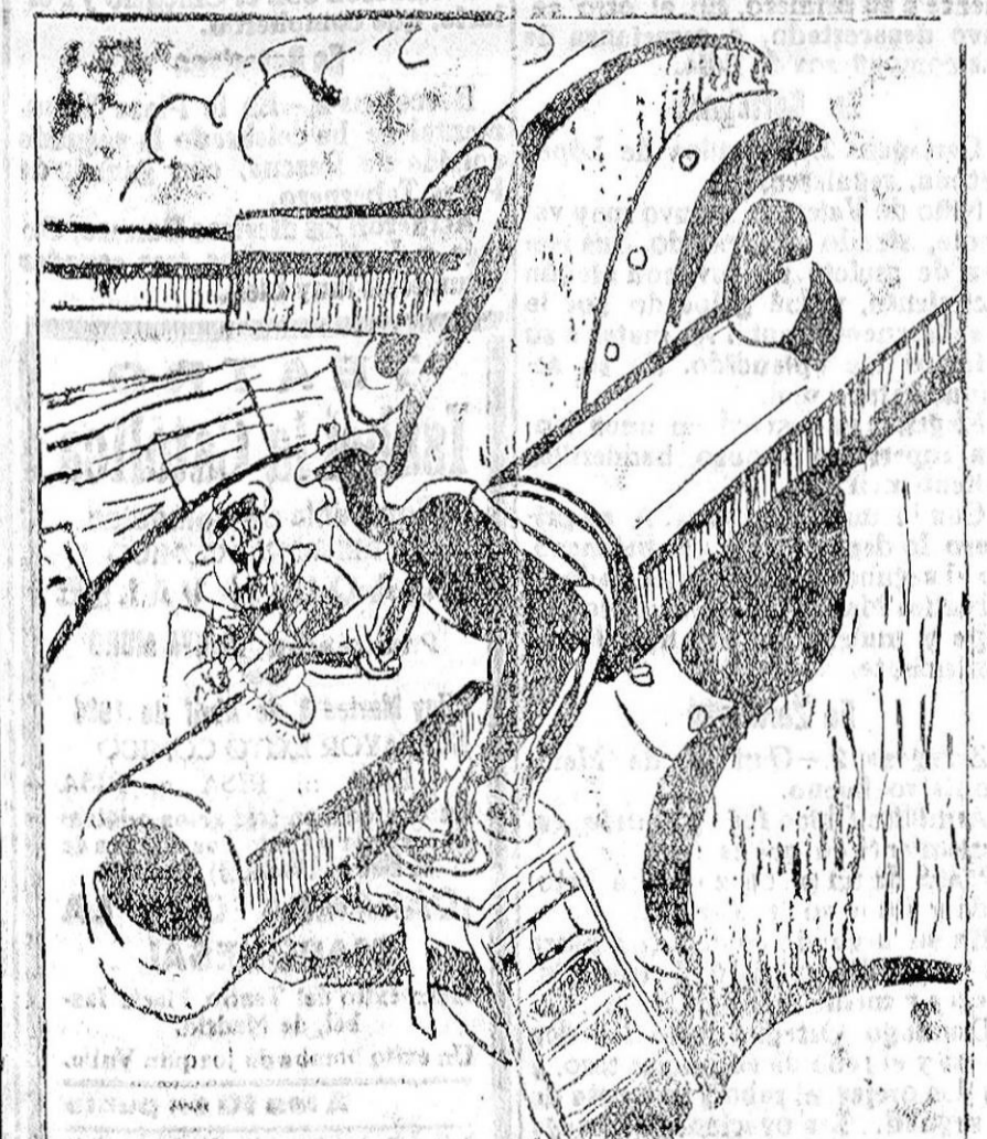
—Si tuvieran ellos que limpiar estos cañones tan grandes ya habrían llegado al desarme. —¡Que te creas tú caol! ¿Y de qué iban a vivir si suprimieran la guerra? (De «La Roca»)

Sufrió la fractura de la pierna izquierda, lo que se ocasionó al caer por un barranco existente en una finca del mencionado pueblo,