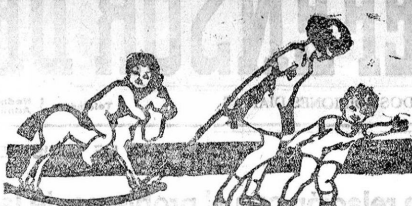
Las jugadoras deben estar siempre...