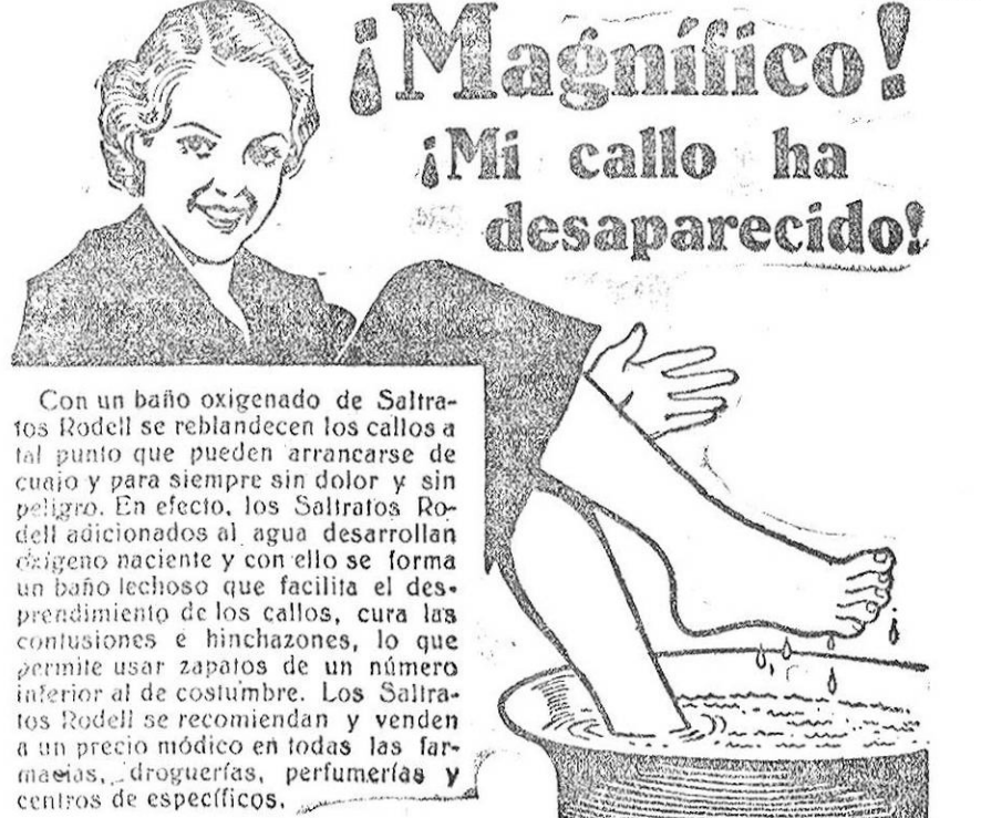
Con un baño oxigenado de Saltratos Rodell se reblandecen los callos a tal punto que pueden arrancarse de cuajo y para siempre sin dolor y sin peligro.

—No os dé eso cuidado... dijo Cloarek con mal humor—, no os pondré delante de ella... Y Cloarek, haciendo pasar al señor Verduron por un corredor, le introdujo en su gabinete.