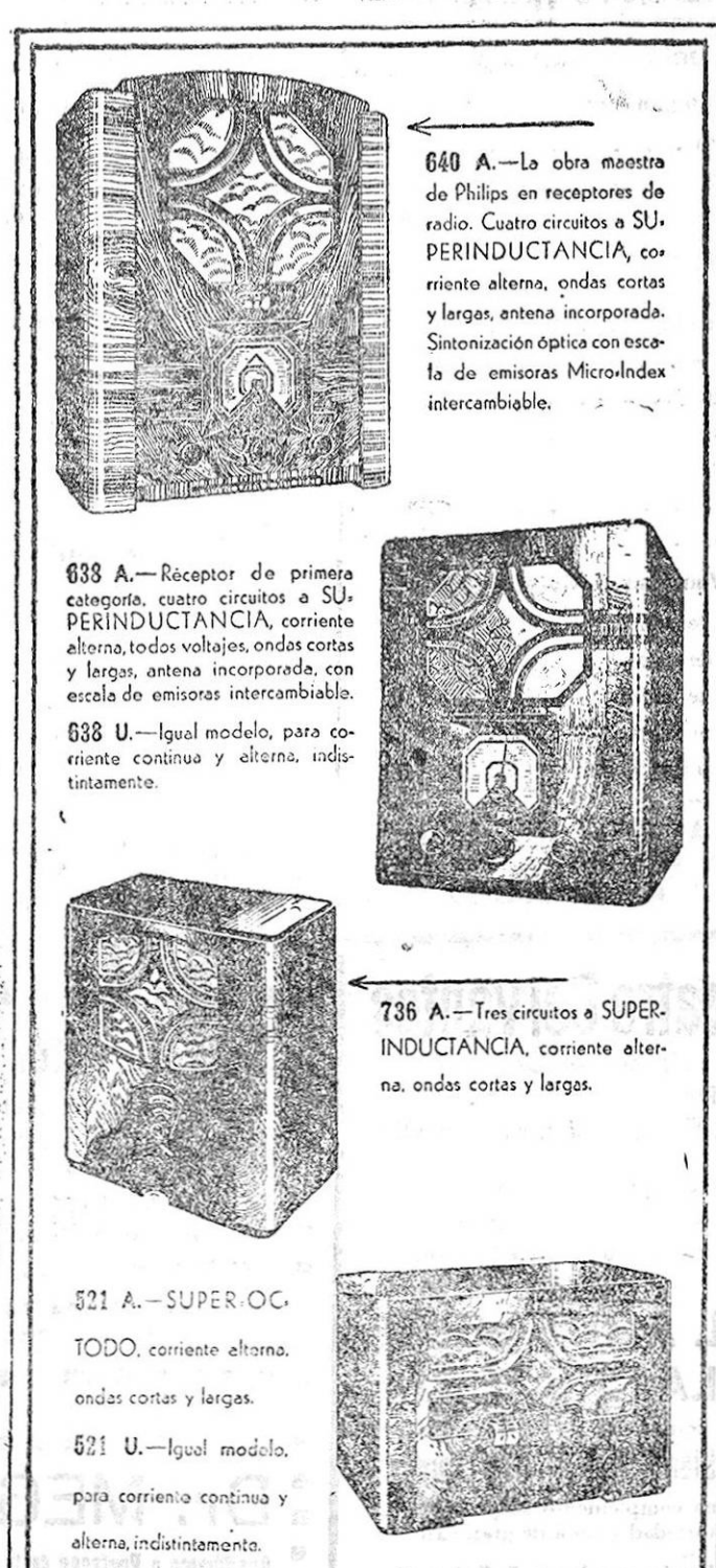
640 A.—La obra muestra de Philips en receptores de radio. Cuatro circuitos a SUPERINDUCTANCIA, corriente alterna, ondas cortas y largas, antena incorporada. Sintonización óptica con escala de emisoras MicroIndex intercambiable. 633 A.—Receptor de primera categoría, cuatro circuitos a SUPERINDUCTANCIA, corriente alterna, todos volajes, ondas cortas y largas, antena incorporada, con escala de emisoras intercambiable. 638 U.—Igual modelo, para corriente continua y alterna, indistintamente. 736 A.—Tres circuitos a SUPERINDUCTANCIA, corriente alterna, ondas cortas y largas. 621 A.—SUPER OC. TODO, corriente alterna, ondas cortas y largas. 624 U.—Igual modelo, para corriente continua y alterna, indistintamente.