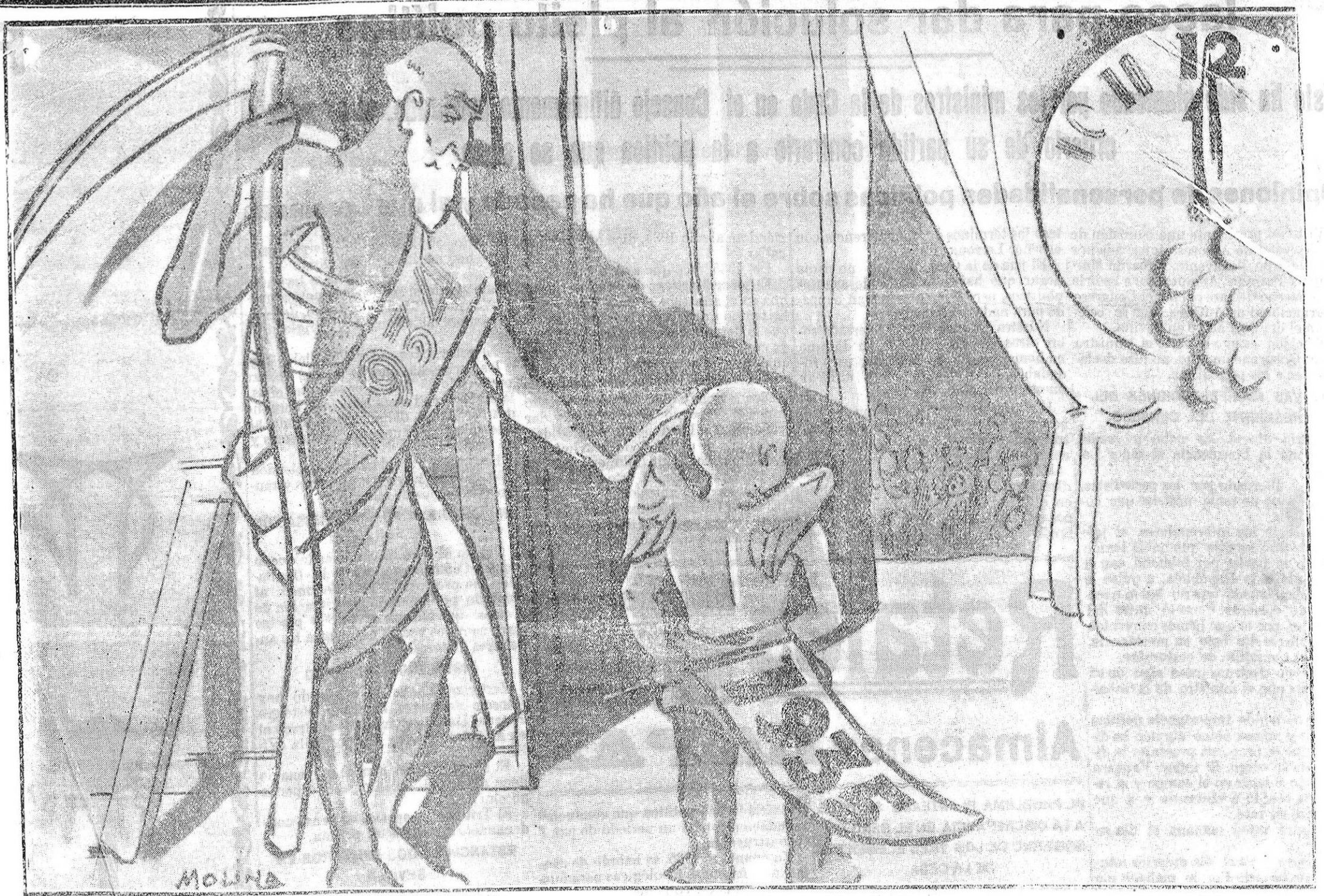
ALEGORÍA DE AÑO NUEVO, por Roberto Molina

Madrid 31.—Los servicios municipales de asistencia social durante el año pasado, en un distribuido de un millón de comidas a los trabajadores en