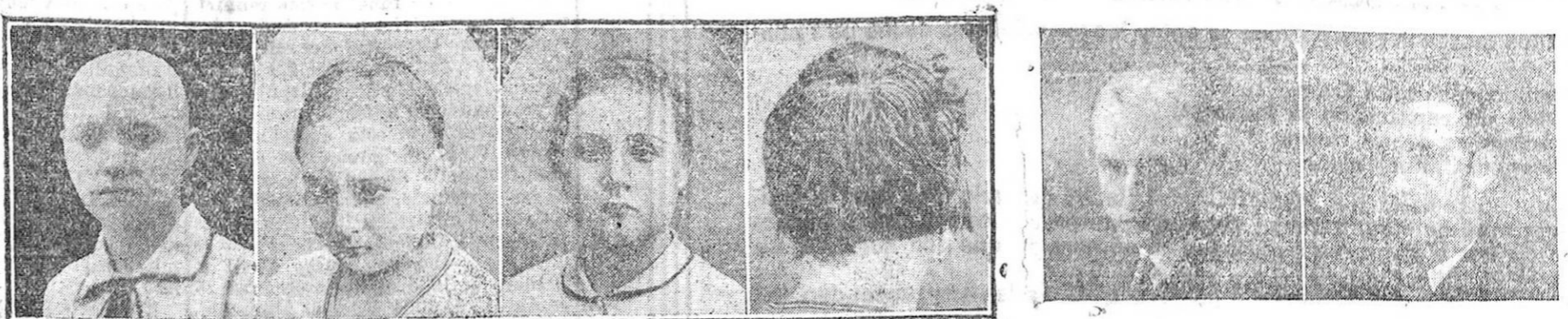
Exposición permanente de casos curados después de 30 años de calvicie.

65.000 cartas afirman la eficacia; 150.000 casos curados en el mundo entero, reconocidos por las autoridades españolas y extranjeras, habiendo recibido las más altas recompensas.—El inventor del CAPILAR J. MOURADE, universalmente conocido por sus maravillosas curas (muy conocido en provincias por haber curado una infinidad de casos rebeldes de calvicie).—Película sensacional científica que se proyectará próximamente con el fin de demostrar prácticamente a los incrédulos sus maravillosas curas después de llevar 30 años de calvicie.—Recibiendo gratuitamente en el Hotel Victoria de 9 a 1 y de 3 a 8