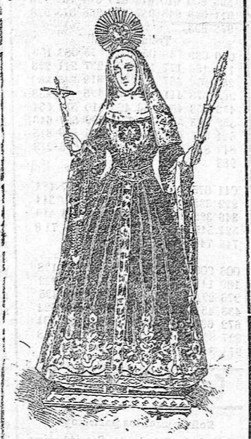
Imagen de Santa Rita que se venera en la iglesia de San Pedro

húrfana, pobre, sin familia ni casi amigos; qué ha de hacer? Se encomienda á Dios, pide con lágrimas á sus devotos santos que le ayuden; y si por casualidad un pariente desconocido se acuerda de ella, ó un hombre honrado la solicita y se casa, ¿quién tendrá derecho á profanar su fé? Al borde de la ruina, ó al borde del sepulcro, cuántas veces no surgen hechos imprevistos, sucesos inesperados que cambian la faz de las cosas, como aquellos súbitos cambios de los poemas clásicos, que los retróicos llamaban mutaciones , cambiaban la situación de los