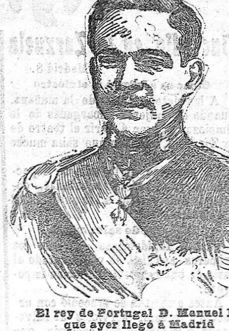
El rey de Portugal D. Manuel II, que ayer llegó á Madrid