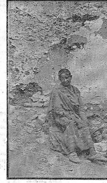
Las cuevas del Sacro-Monte