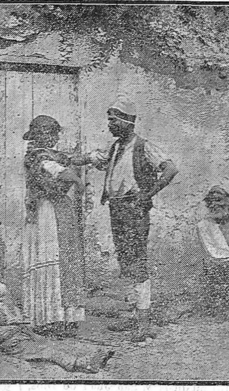
Las cuevas del Sacro-Monte